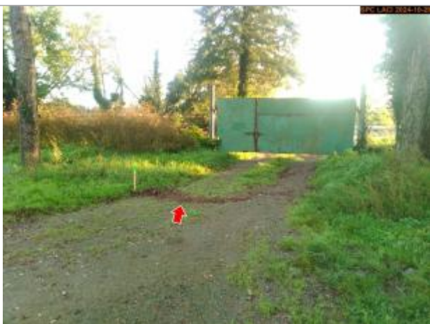
Vue du repère, en 2024