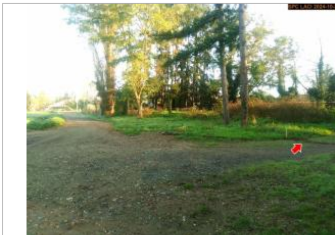
Vue du site en 2024, avec le repère de la crue d'octobre 2024

Coordonnées WGS84 : X: 3.49979200 / Y: 45.09838500