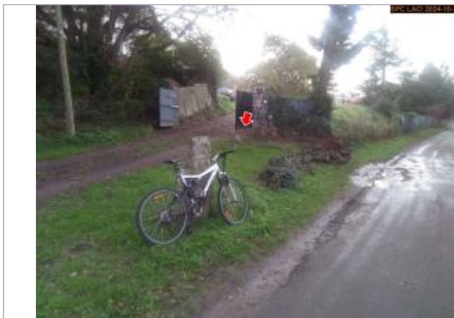
Vue du site en 2024, avec le repère de la crue d'octobre 2024

Coordonnées WGS84 : X: 3.54402800 / Y: 45.07031700