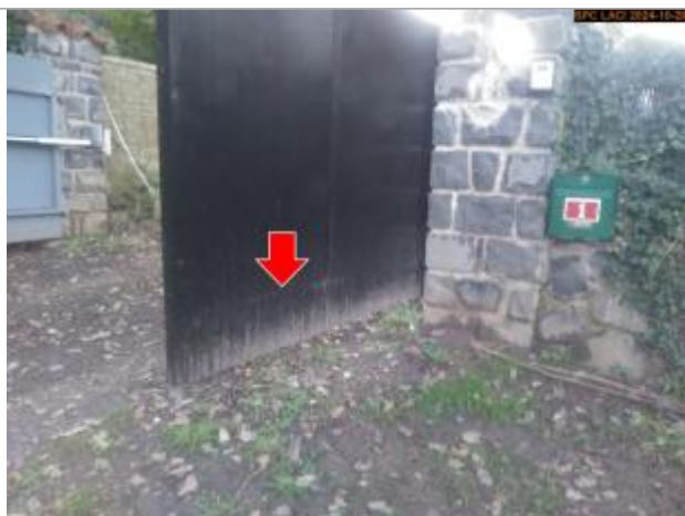
Vue du repère, en 2024