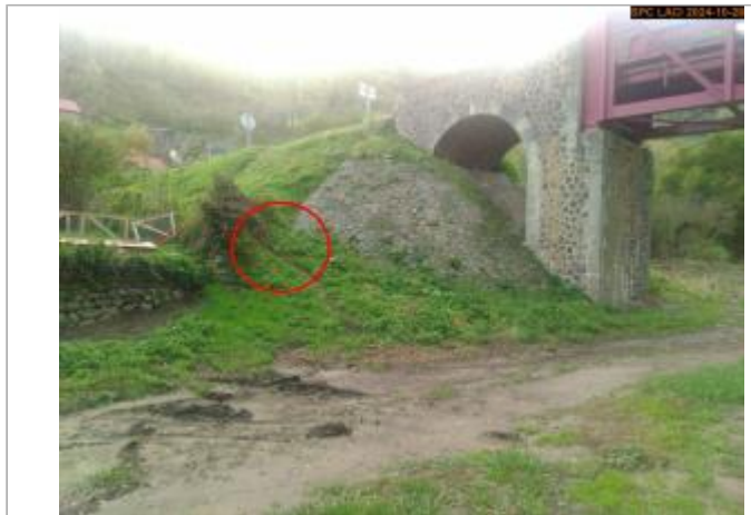
Vue du site en 2024, avec l'emplacement du repère de la crue d'octobre 2024

Coordonnées WGS84 : X: 3.58328300 / Y: 45.04770900