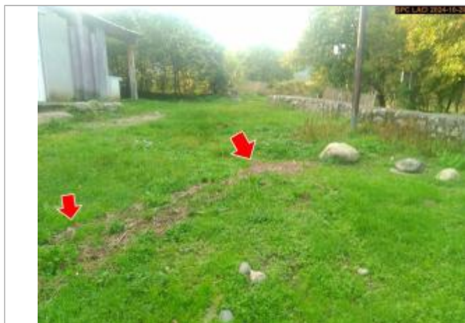
Vue du repère, en 2024