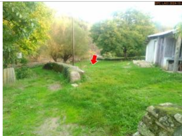
Vue du site en 2024, avec le repère de la crue d'octobre 2024