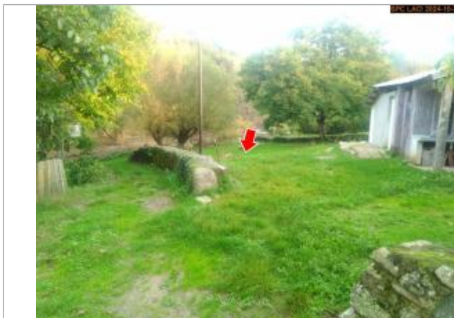
Vue du site en 2024, avec le repère de la crue d'octobre 2024

Coordonnées WGS84 : X: 3.59646500 / Y: 45.02762500