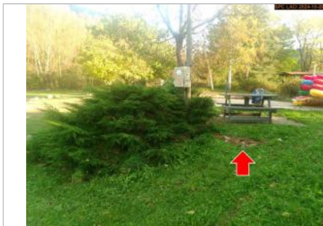
Vue du repère, en 2024