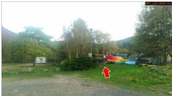
Vue du site en 2024, avec le repère de la crue d'octobre 2024

Coordonnées WGS84 : X: 3.59539900 / Y: 45.02873400