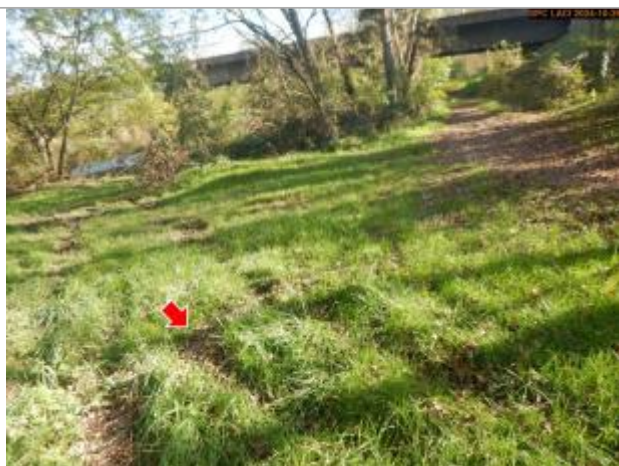
Vue du repère, en 2024