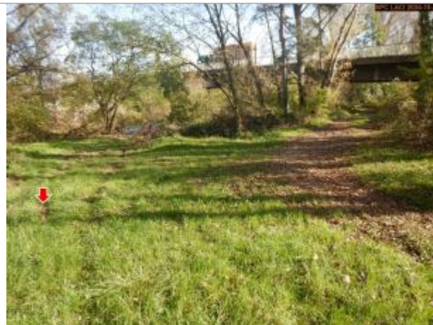
Vue du site en 2024, avec le repère de la crue d'octobre 2024

Coordonnées WGS84 : X: 3.40525900 / Y: 45.30338100