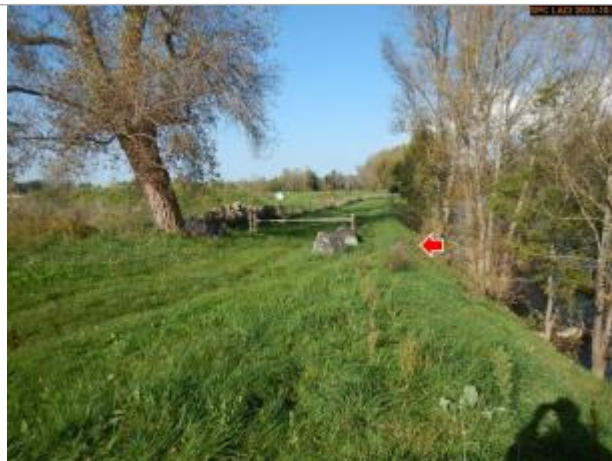
Vue du site en 2024, avec le repère de la crue d'octobre 2024

Coordonnées WGS84 : X: 3.40988300 / Y: 45.28937800