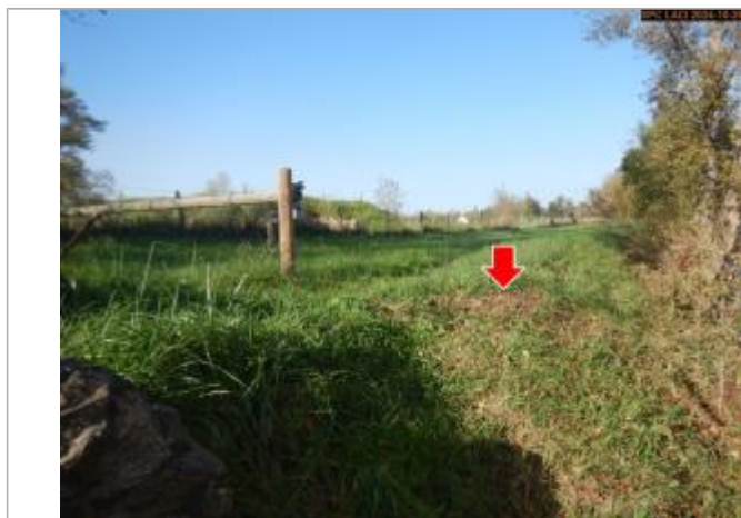
Vue du repère, en 2024