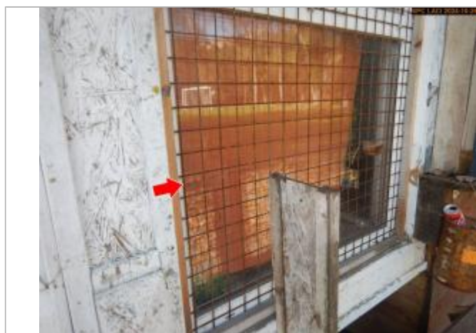
Vue du repère, en 2024. La laisse se trouve derrière la grille, sur la vitre.