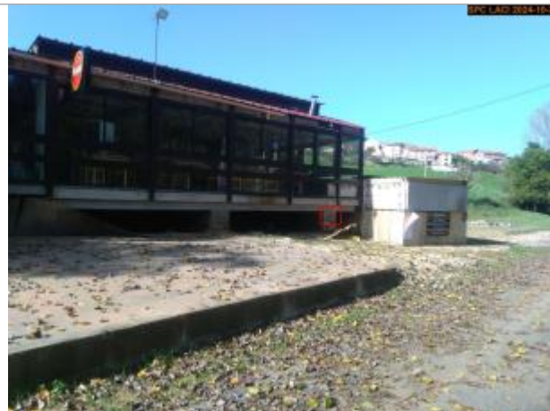
Vue du site en 2024, avec le repère de la crue d'octobre 2024

Coordonnées WGS84 : X: 3.39826500 / Y: 45.20755800