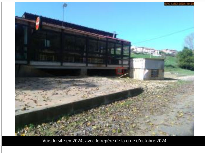
Vue du site en 2024, avec le repère de la crue d'octobre 2024