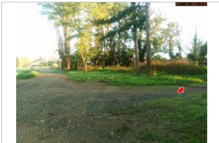
Vue du site en 2024, avec le repère de la crue d'octobre 2024