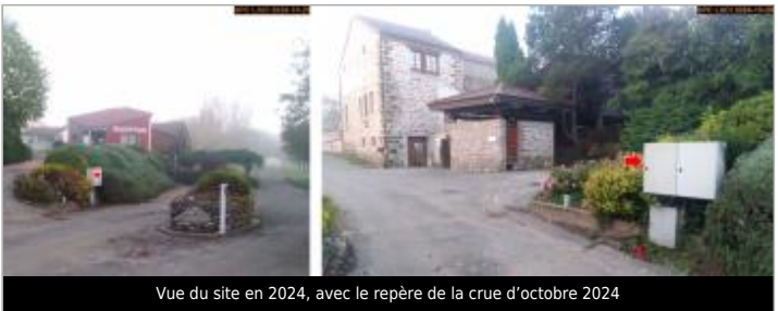
Vue du site en 2024, avec le repère de la crue d'octobre 2024