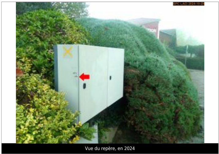
Vue du repère, en 2024