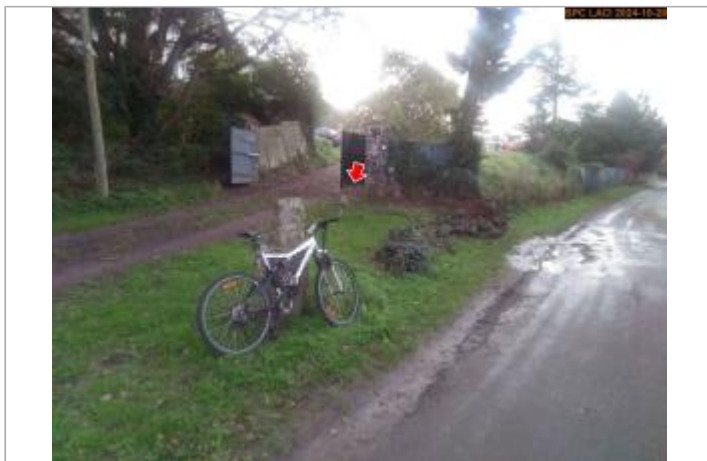
Vue du site en 2024, avec le repère de la crue d'octobre 2024

Coordonnées WGS84 : X: 3.54402800 / Y: 45.07031700