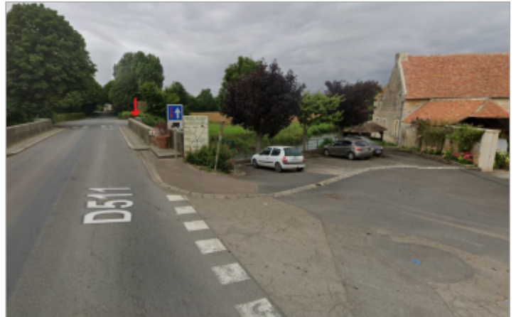
Vue large pont de Jort depuis la D511 en arrivant de Carel (SMBD)

Coordonnées WGS84 : X: -0.08092312 / Y: 48.97653570