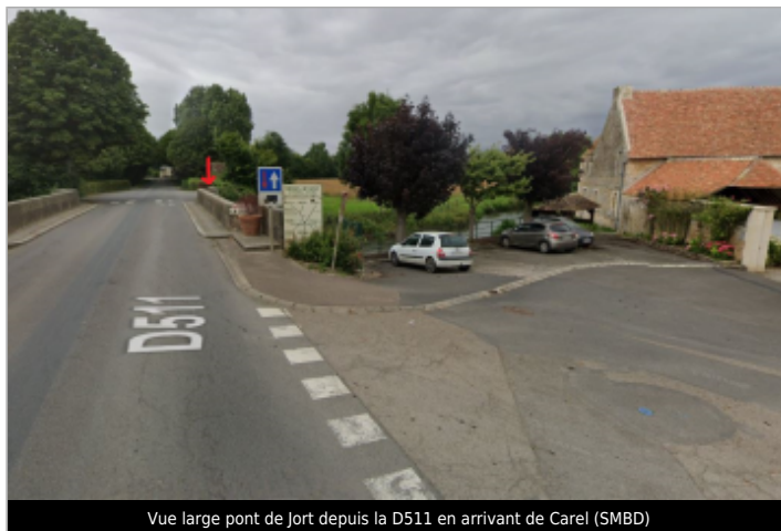
Vue large pont de Jort depuis la D511 en arrivant de Carel (SMBD)