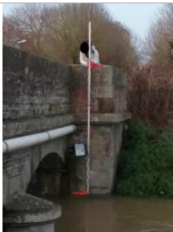
Pile de pont gauche, face aval, pont de Jort - Vue depuis la rive droite

Altitude calculée de l'eau (en m) : 34.88