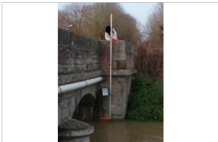
Pile de pont gauche, face aval, pont de Jort - Vue depuis la rive droite