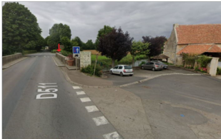
Vue large pont de Jort depuis la D511 en arrivant de Carel (SMBD)