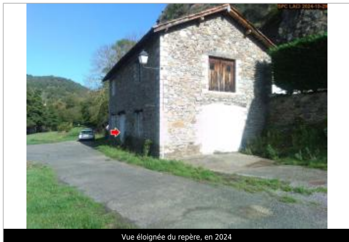
Vue éloignée du repère, en 2024

SOURCE DE REPÉRAGE : SPC LACI ET DDT43, L'ALLIER, CRUE DU 17 OCTOBRE 2024 - 29/10/2024