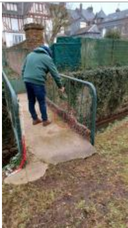
Laisse de crue à 26 cm/sol.

NIVELLEMENT SPC SACN. LE SPC N'EST PAS GÉOMÈTRE EXPERT, LES COTES SONT DONNÉES À TITRE INDICATIF. - 23/01/2025