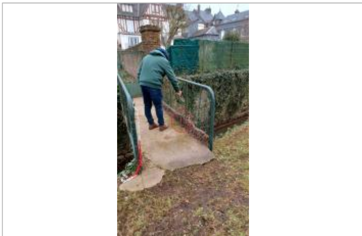
Laisse de crue à 26 cm/sol.

MARQUE Maximum de l'inondation : Oui Visibilité : Oui État du repère : Mauvais Pérennité : Aucune Repère calculé : Non PHEC : Non renseigné