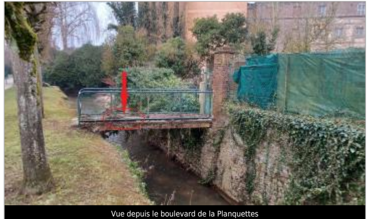
Vue depuis le boulevard de la Planquettes

Coordonnées WGS84 : X: 1.72956230 / Y: 49.48169460