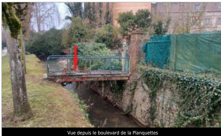
Vue depuis le boulevard de la Planquettes

GÉOLOCALISATION Coordonnées WGS84 : X: 1.72956230 / Y: 49.48169460 Coordonnées RGF93 (Lambert 93) X: 607905.86 / Y: 6932109.58 Coordonnées RGF93 (ETRS89) : X: 1.7295623 / Y: 49.4816946 Code Hydro : H31-0400 Rive de référence : Droite