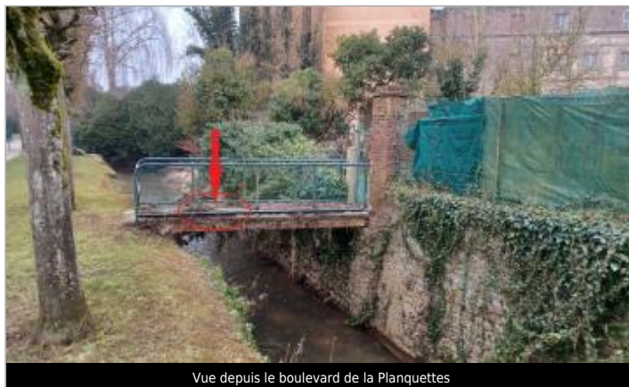
Vue depuis le boulevard de la Planquettes