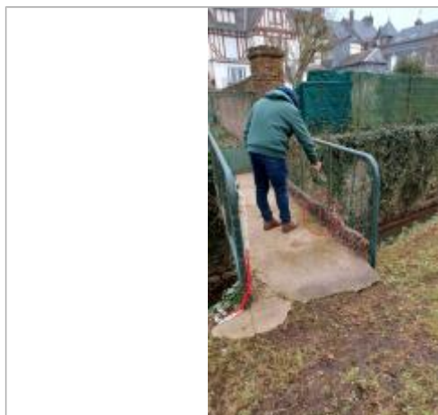
Laisse de crue à 26 cm/sol.

Maximum de l'inondation : Oui Visibilité : Oui État du repère : Mauvais Pérennité : Aucune Repère calculé : Non PHEC : Non renseigné