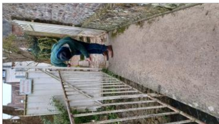
Laisse de crue à 37 cm/sol.