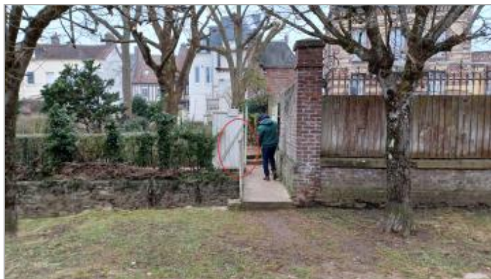
Vue du boulevard des Planquettes