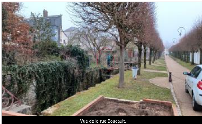
Vue de la rue Boucault.