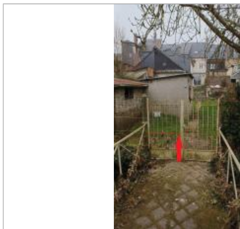
Laisse de crue à 62 cm/sol.

Altitude calculée de l'eau (en m) : 91.79 m