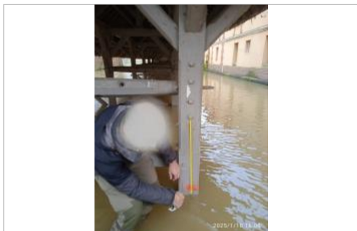
Marque peinte sur le poteau bois à 65 cm depuis le premier écrou/boulon au dessus