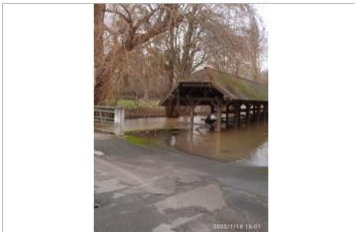
Poteau bois du lavoir, premier à droite / en aval du pont en RD / vue large