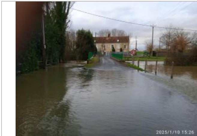
Passage pêcheur en Y à droite du panneau "non prioritaire" / vue large depuis la D16