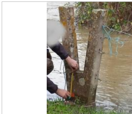
Marque peinte à 27,5cm depuis le haut (base du V), passage pêcheur en Y béton