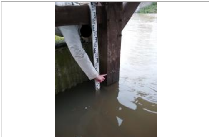
Débris végétaux à 30 cm du sol sur le poteau du lavoir/ Vue large (DDTM14)