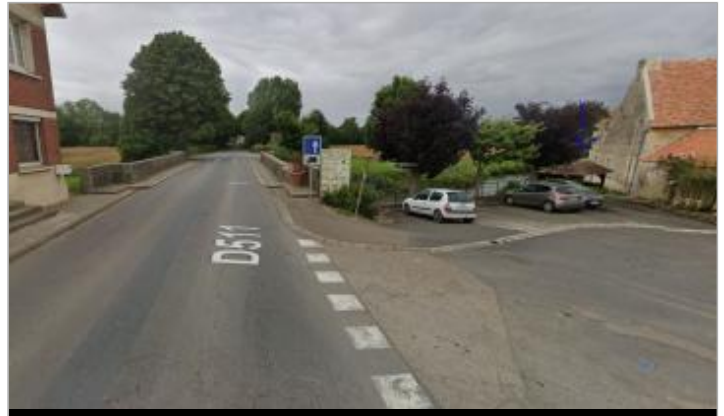
Pont et parking / Vue large depuis la route en arrivant de Carel (SMBD)