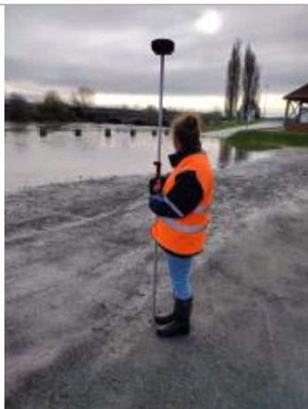
Laisse de crue sur parking camping car n°1