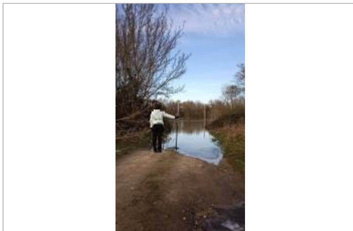
Vue sur la laisse d'inondation

Coordonnées WGS84 : X: -1.33860902 / Y: 47.30590990