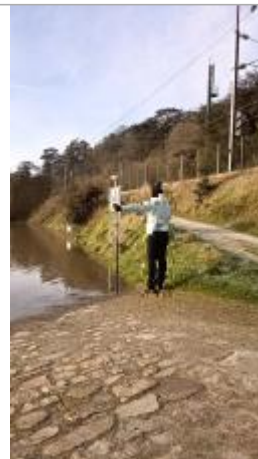
Vue sur la cale de mise à l'eau