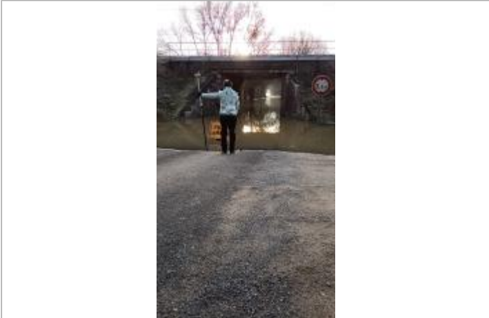
Vue sur la route coupée