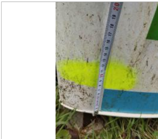
bas du totem et lecture de la prise de mesure

NIVELLEMENT SPC SACN. LE SPC N'EST PAS GÉOMÈTRE EXPERT, LES COTES SONT DONNÉES À TITRE INDICATIF. - 02/04/2025