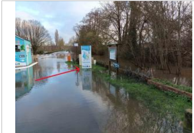
Vue en arrivant à l'entrée du site du Lac Terre d'Auge