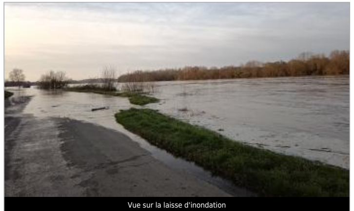
Vue sur la laisse d'inondation