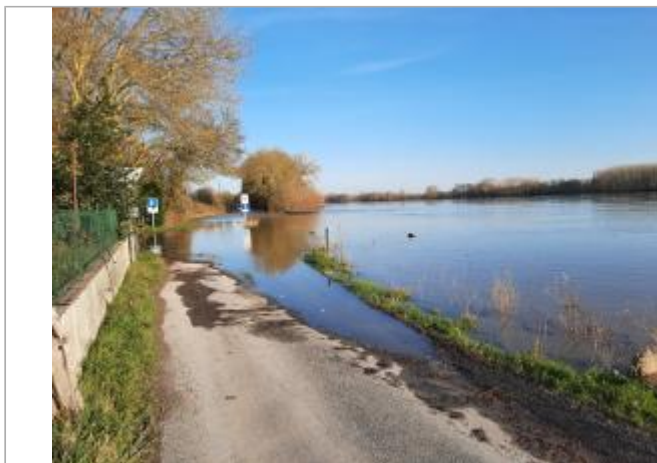
Vue sur la laisse d'inondation

Coordonnées WGS84 : X: -1.01578284 / Y: 47.37162370