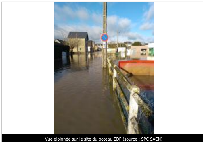
Vue éloignée sur le site du poteau EDF