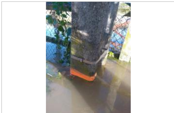
Vue de profil, marque 10 à 15 cm en dessous du feuillard métal