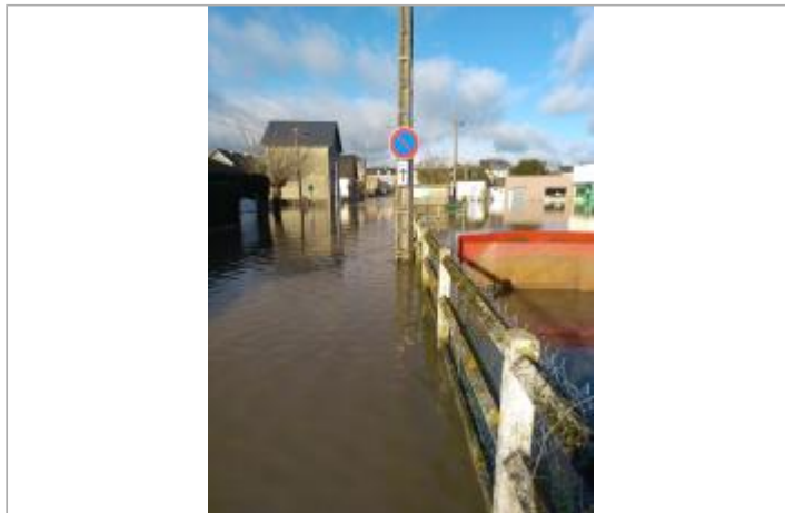
Vue éloignée sur le site du poteau EDF