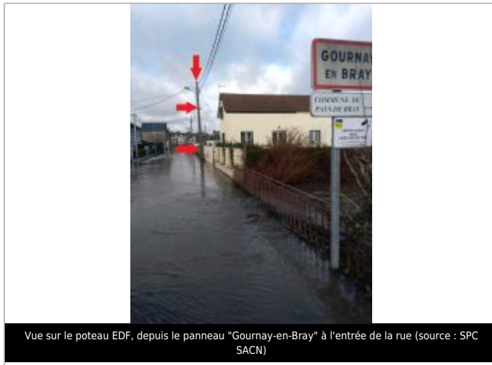
Vue sur le poteau EDF, depuis le panneau "Gournay-en-Bray" à l'entrée de la rue