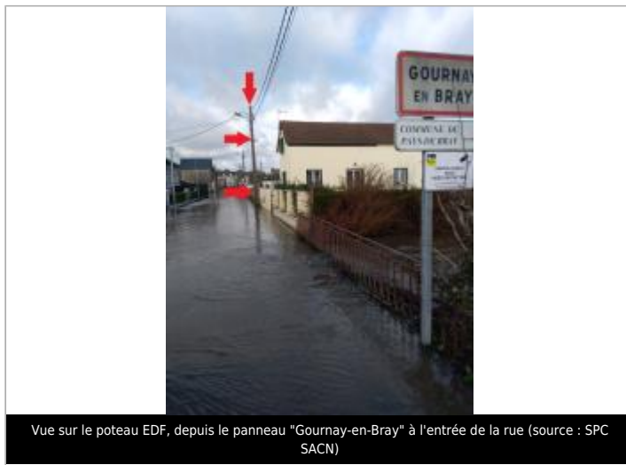
Vue sur le poteau EDF, depuis le panneau "Gournay-en-Bray" à l'entrée de la rue