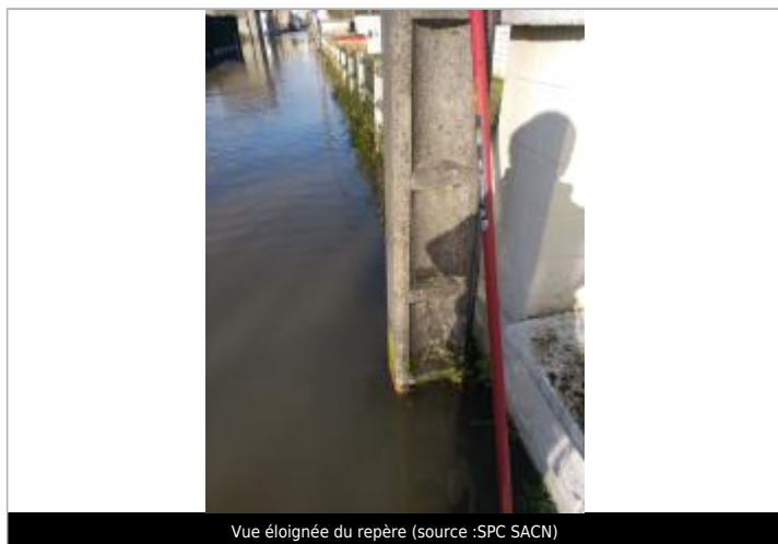
Vue éloignée du repère