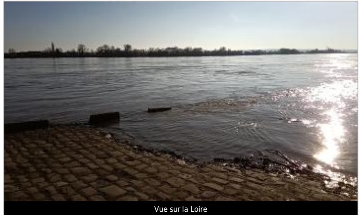
Vue sur la Loire