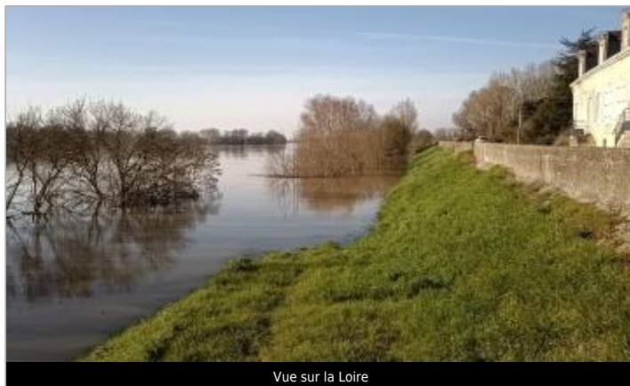
Vue sur la Loire