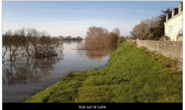
Vue sur la Loire