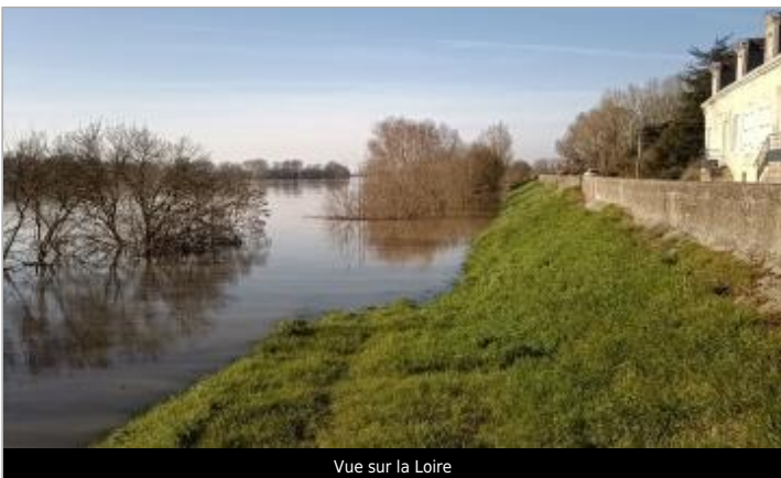
Vue sur la Loire

GÉOLOCALISATION Coordonnées WGS84 : X: -0.83399205 / Y: 47.39114990 Coordonnées RGF93 (Lambert 93) X: 410891.6 / Y: 6705998.81 Coordonnées RGF93 (ETRS89) : X: -0.8339921 / Y: 47.3911499 Code Hydro: ----0000 Rive de référence: