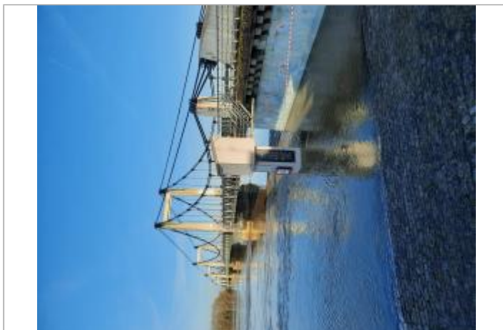
Vue sur le pont et la plaque