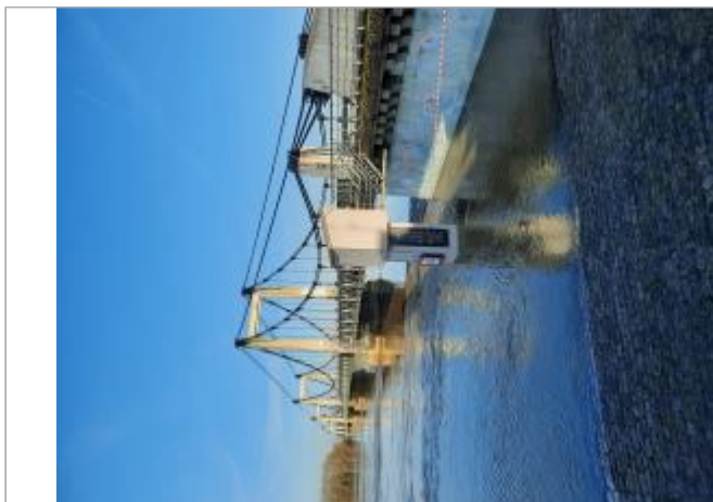
Vue sur le pont et la plaque

Coordonnées WGS84 : X: -0.86166937 / Y: 47.39234290