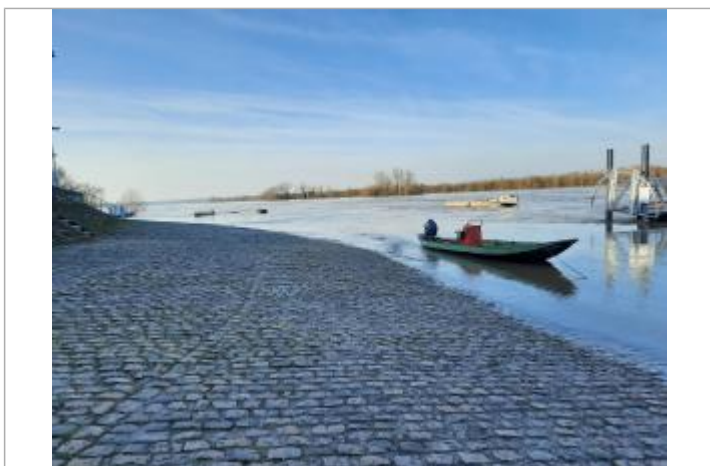
Vue sur le quai à l'aval du pont