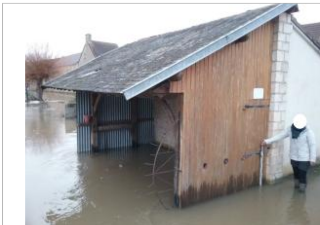
partie en bois de l'ancien lavoir situé rue des Douits à vendevre

Coordonnées WGS84 : X: -0.07418640 / Y: 48.99096570