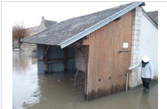
partie en bois de l'ancien lavoir situé rue des Douits à vendevre