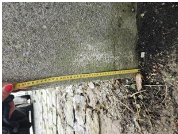
12.5 centimètres du sol à la marque, pilier gauche de la barrière

Altitude calculée de l'eau (en m) : 93.39 m