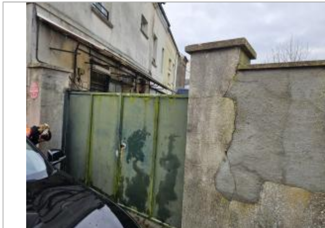
barrière d'accès à la cour du magasin

Coordonnées WGS84 : X: 1.72662500 / Y: 49.48511880