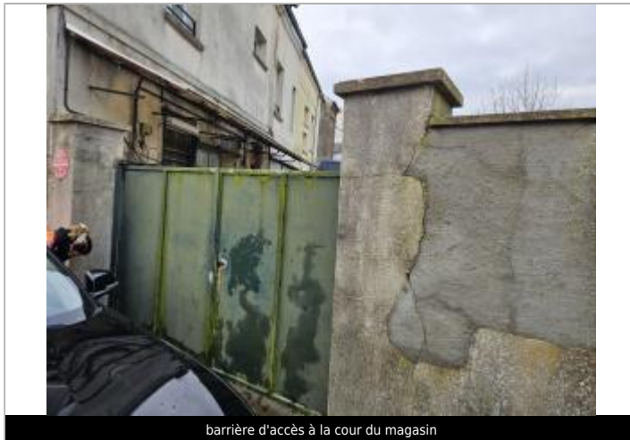
barrière d'accès à la cour du magasin