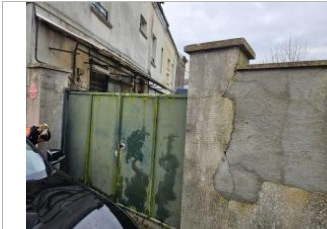
barrière d'accès à la cour du magasin