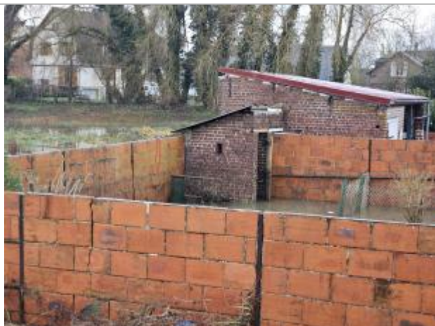
3ème brique en partant du haut du mur= marque de laisse de crue