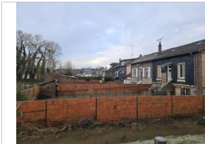
Mur du jardin arrière de la maison

Coordonnées WGS84 : X: 1.73120022 / Y: 49.48452990