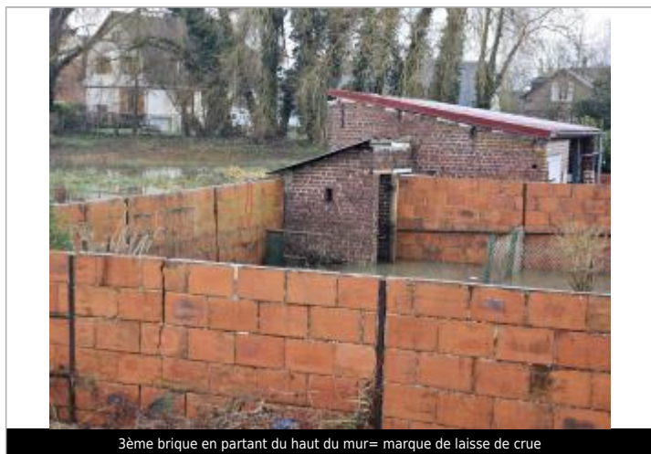
3ème brique en partant du haut du mur = marque de laisse de crue

SOURCE DE REPÉRAGE : RELEVÉS PHE DU 9/01/25 CRUE DE L'EPTE - 10/01/2025