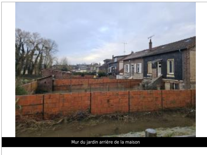
Mur du jardin arrière de la maison