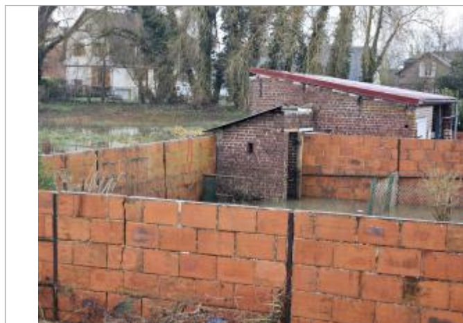
3ème brique en partant du haut du mur= marque de laisse de crue

SOURCE DE REPÉRAGE : RELEVÉS PHE DU 9/01/25 CRUE DE L'EPTE - 10/01/2025