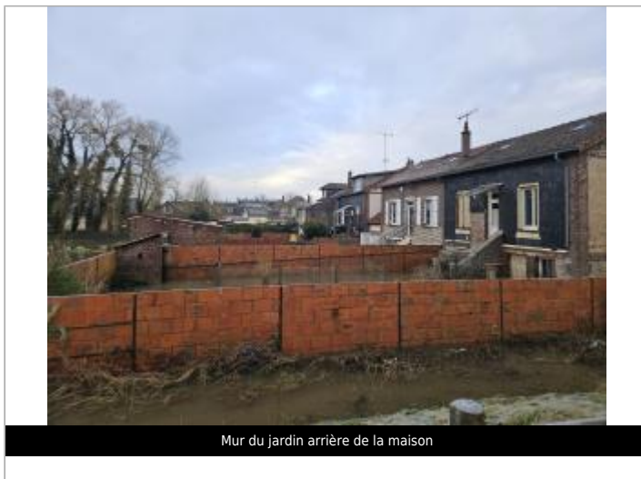
Mur du jardin arrière de la maison