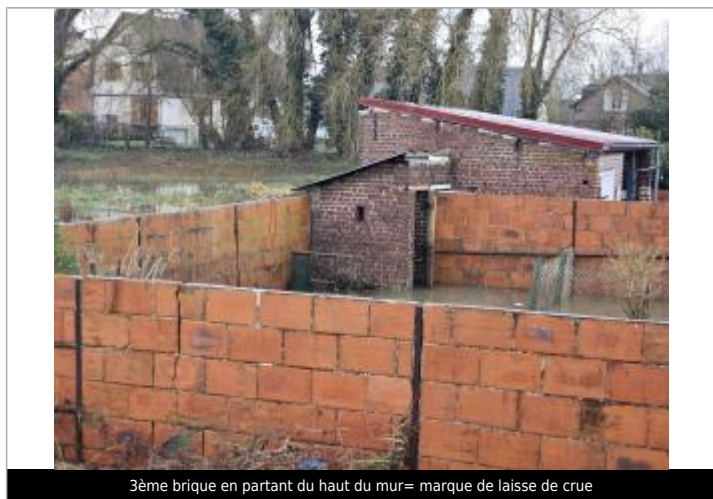
3ème brique en partant du haut du mur= marque de laisse de crue

Altitude calculée de l'eau (en m) : 93.33