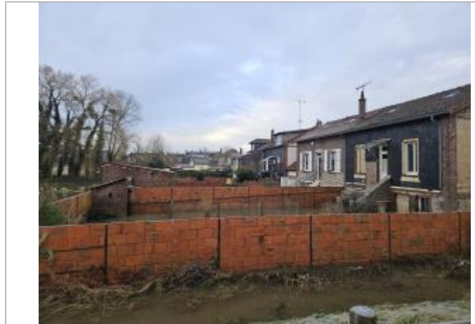
Mur du jardin arrière de la maison

Coordonnées WGS84 : X: 1.73120022 / Y: 49.48452990