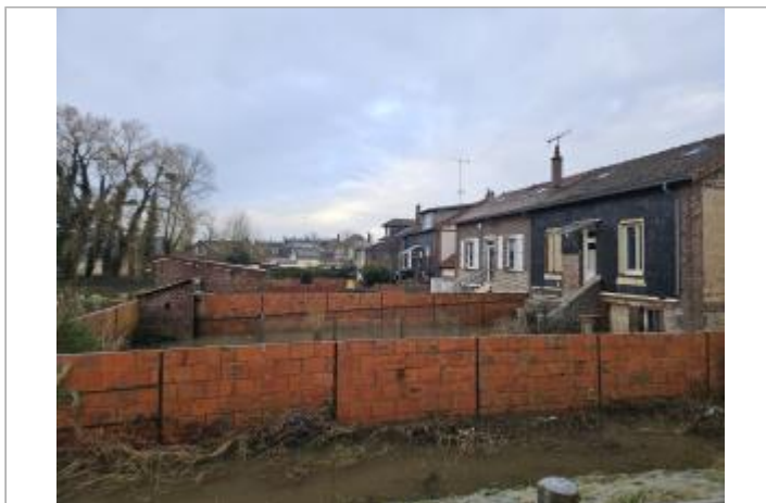
Mur du jardin arrière de la maison