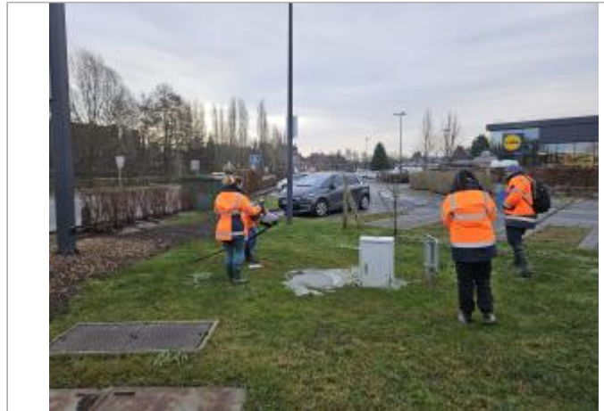
Au bout du parking à droite, partie herbeuse

Coordonnées WGS84 : X: 1.73161656 / Y: 49.48443690