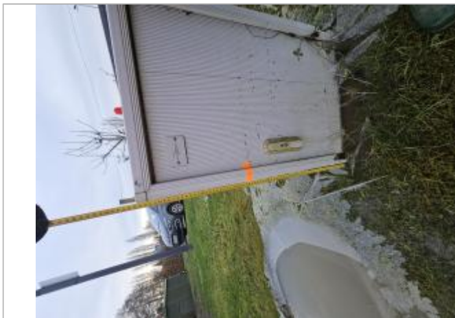
45 cm du sol au bas de la marque