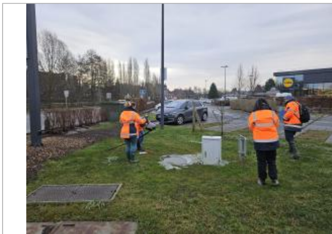
Au bout du parking à droite, partie herbeuse