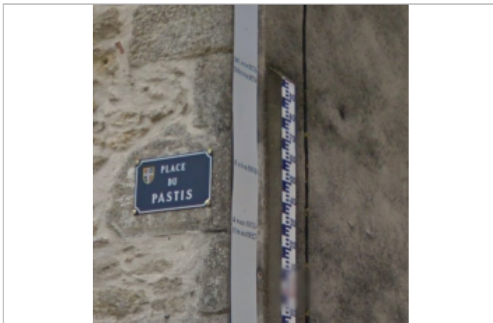
Vue du repère