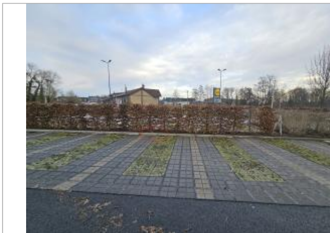
6ème place de parking du début de l'allée centrale