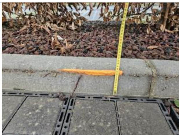
9 cm en haut du trottoir

Altitude calculée de l'eau (en m) : 93.36