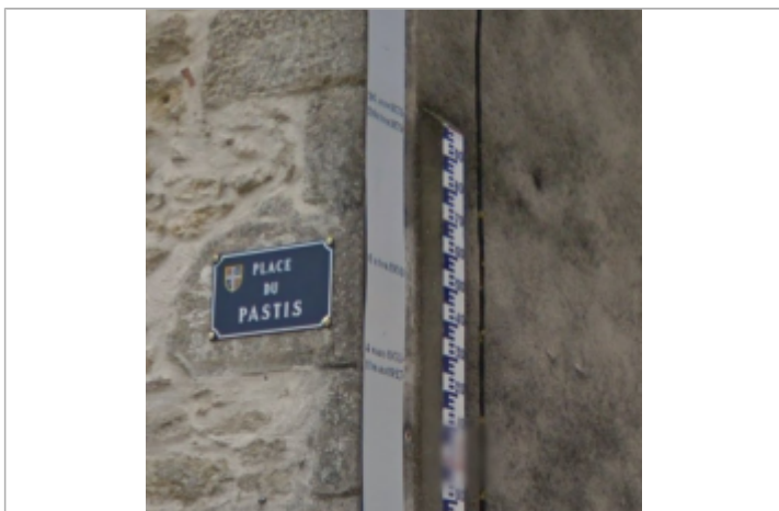
Vue du repère

MARQUE Maximum de l'inondation : Oui Visibilité : Oui État du repère : Bon Pérennité : Longue