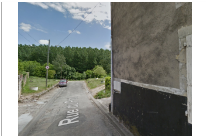
Vue du site