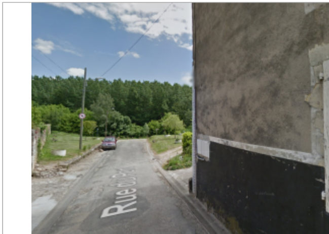
Vue du site