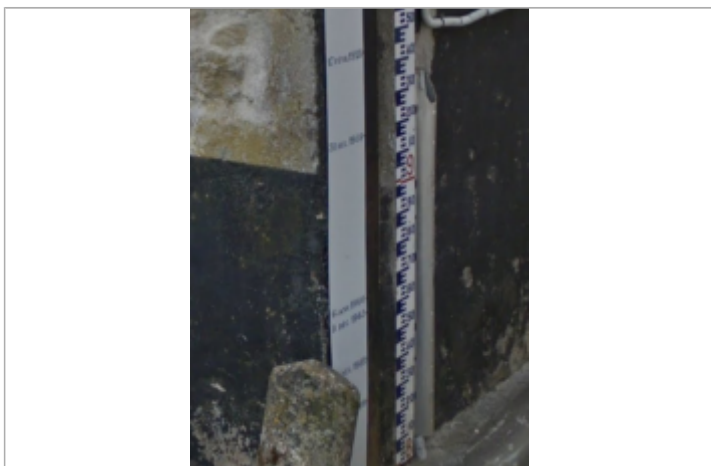
Vue du repère

MARQUE Maximum de l'inondation : Oui Visibilité : Oui État du repère : Bon Pérennité : Longue