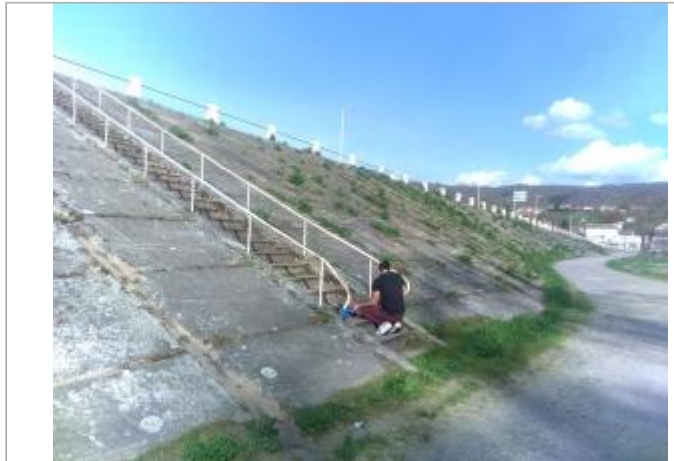
Vue du site en 2024, avec le repère de la crue de mars 2024

Coordonnées WGS84 : X: 3.33578600 / Y: 45.42835800