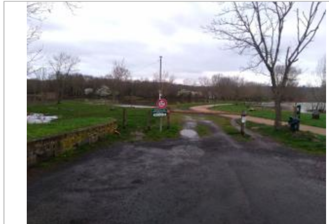
Vue du site en 2024, avec le repère de la crue de mars 2024

Coordonnées WGS84 : X: 3.23702800 / Y: 45.77113900