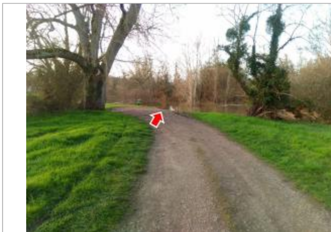
Vue du site en 2024, avec le repère de la crue de mars 2024

Coordonnées WGS84 : X: 3.03582500 / Y: 46.76377700