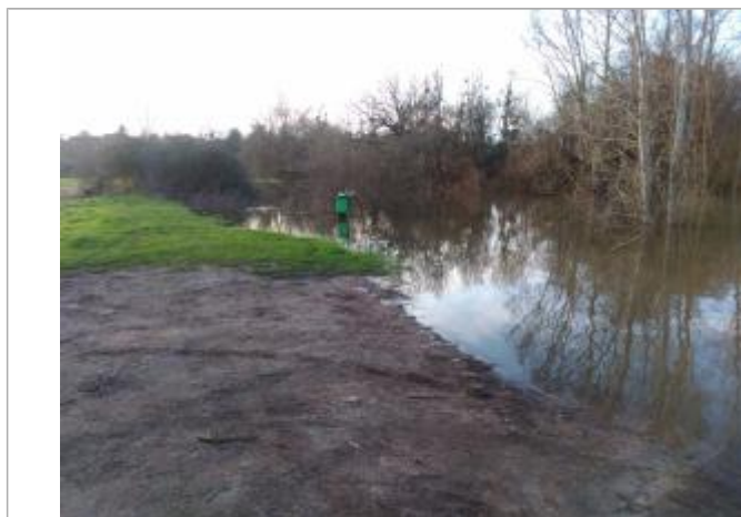
Niveau de l'Allier, avant le pic de crue