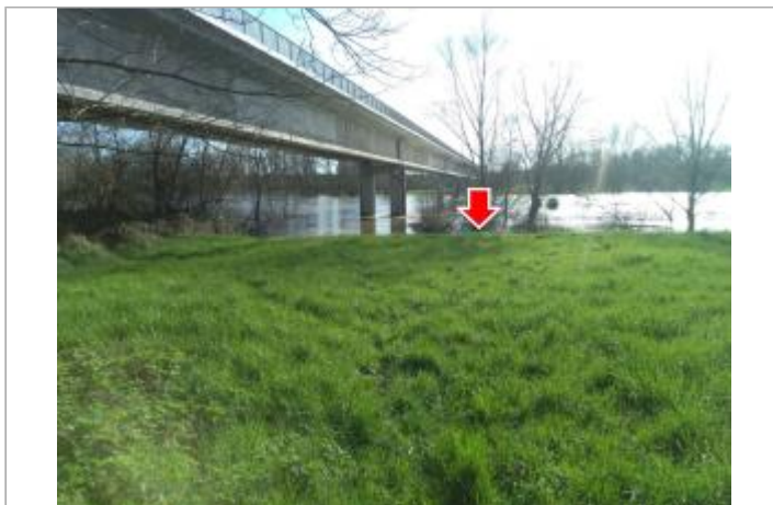
Vue du site en 2024, avec l'emplacement du repère de la crue de mars 2024