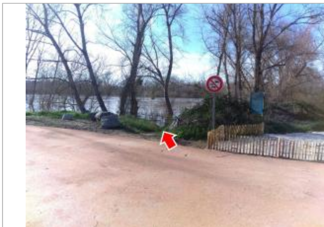
Vue du site en 2024, avec le repère de la crue de mars 2024

Coordonnées WGS84 : X: 3.30196900 / Y: 46.58637900